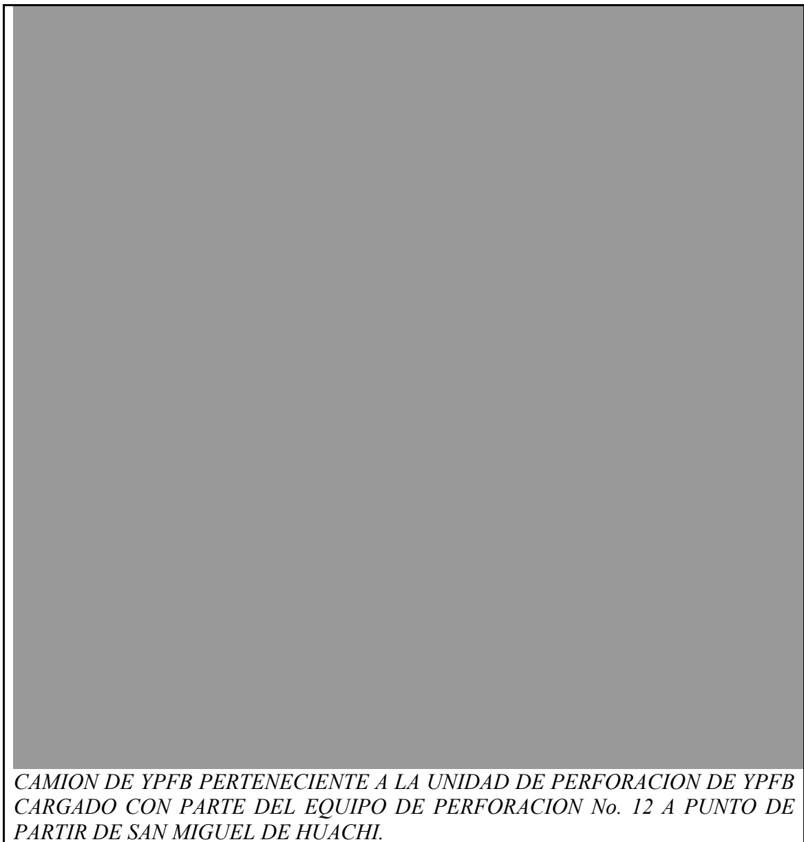
CAMION DE YPFB PERTENECIENTE A LA UNIDAD DE PERFORACION DE YPFB CARGADO CON PARTE DEL EQUIPO DE PERFORACION No. 12 A PUNTO DE PARTIR DE SAN MIGUEL DE HUACHI.

A continuación fotografías tomadas este sábado 15 de Noviembre del 2008 en San Miguel de Huachi Municipio de Palos Blancos.