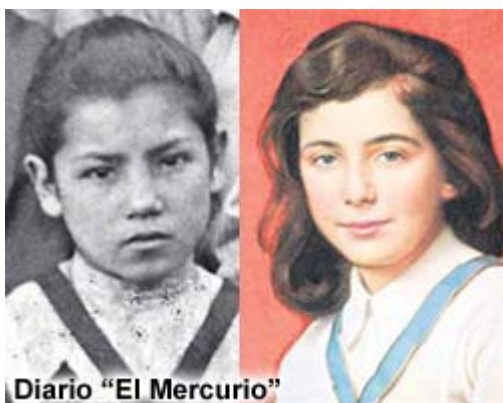
Imagen auténtica / Imagen conocida hasta ahora